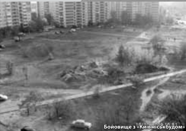
Бойовище з «Київміськбудом»