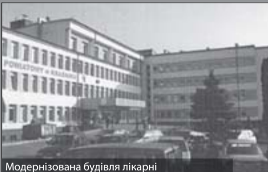
Модернізована будівля лікарні

У Красніку створений Центр Польсько-Української Співпраці. Це найбільший польсько-український навчальний проект органу самоврядування, який реалізовується містом Краснік у партнерстві з інституціями з Польщі та України. Мета діяль-