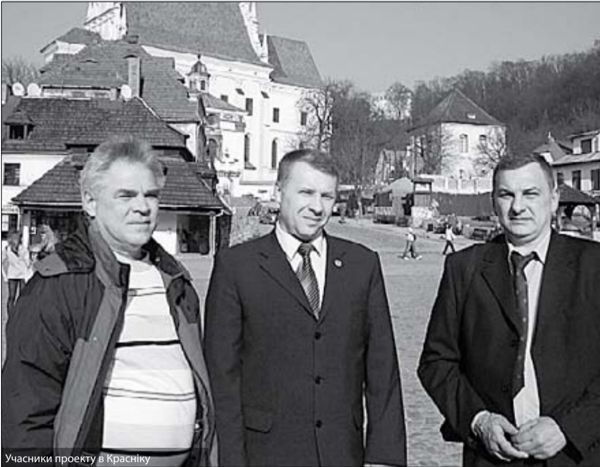
Учасники проекту в Красніку

Близько 10 років тому в Польщі відбулася адмінреформа. Суттю цієї реформи було створення громадянського суспільства, введення нових рівнів управління, які повинні наблизити кожного громадянина до процесу місцевого врядування й стимулювати подальший розвиток громад. У підсумку надбанням гміни стали побудовані школи й шляхи, модернізовані суспільні об'єкти й житлові будинки, лікарні, заклади культури й відпочинку. Тут для вирішення будь-якого питання звертаються в мерію. Людина приходить, розповідає про свою проблему або бажання. Тут його вислухають і підготують перелік необхідних для вирішення його питання документів і роз'яснень. Зате наступного разу, коли громадянин йде в мерію за відповіддю, йому не потрібно ходити по кабінетах: на спеціальному стенді для кожного, хто звернувся, розміщують всю детальну інформацію. Також у Красніку по-