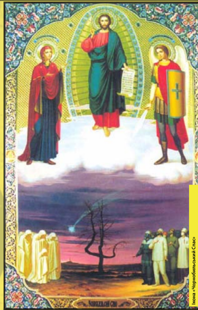
Ікона «Чорнобильський Спас»

грунтові води станції від навколишнього середовища. От, завдяки цьому, жодного разу після аварії не були перевищені санітарні норми по дніпровській воді. Тому вся паніка, що в Дніпрі не можна ні